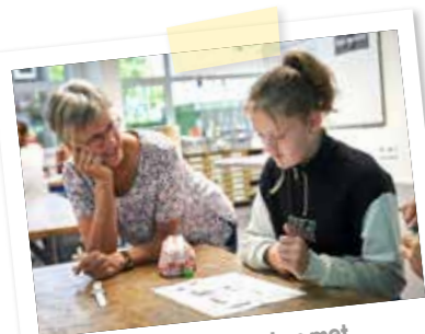
Je kunt van alles bespreken met je docenten!

Op basis van het advies van jouw juf of meester plaatsen we je in een vmbo-t/havoklas, een havo/vwo-klas of vwo-klas. Je krijgt in de vmbo-t/havoklas les op vmbo-t-niveau en in de havo/vwo-brugklas op havoniveau. Je mag ook werken en toetsen doen op het hogere niveau.