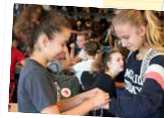
Op de WZ vinden we het belangrijk dat je respect hebt voor jezelf en anderen.

Er is een dagopening in de klas en we vragen een moment stilte in de grote pauze voor de leerlingen die willen bidden. We vieren Kerstmis en Pasen. We doen er allemaal aan mee.