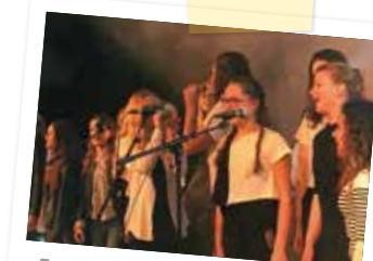
Treed jij op tijdens de jaarlijkse talentenjacht 'WZ on Stage'?

Tijdens de maatschappelijke stage ontdek je wat jij kunt doen voor de maatschappij.